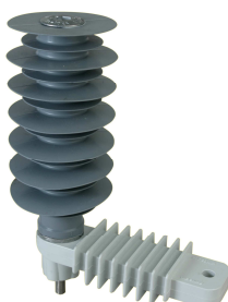
VARISIL™ HE à ENVELOPPE SYNTHETIQUE et à OXYDE DE ZINC de 5 kV à 36 kV